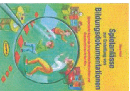
3-6 Jahre Praxis-Spielebuch zur Bildungsdokumentation