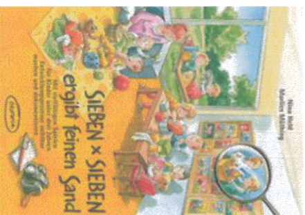
0-3 Jahre Praxis-Spielebuch zur Bildungsdokumentation